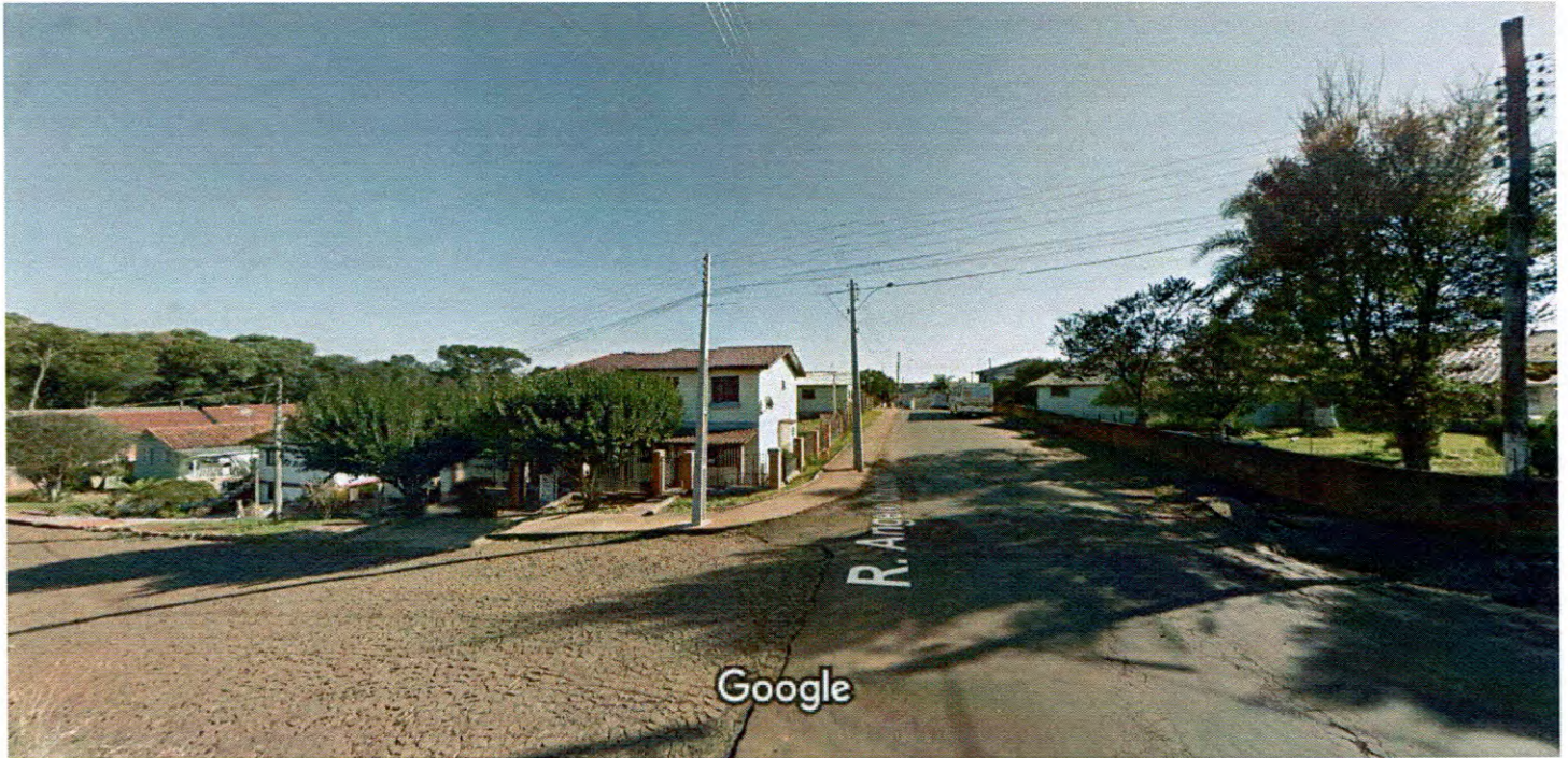
Captura da imagem: jun. 2012