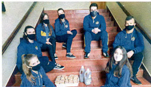
Os alunos foram incentivados a coletar óleo usado em um restaurante da cidade e transformar em sabão em barra, para utilizar em suas residências

O que fazer com o óleo de cozinha que sobrou depois de fritar os alimentos? Já pensou em produzir seu próprio sabão em barra reutilizando este óleo?